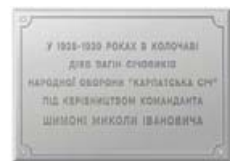
Ескіз меморіальної дошки колочавським січовикам.