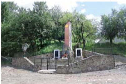
Відреставрований обеліск з уточненими списками загиблих.