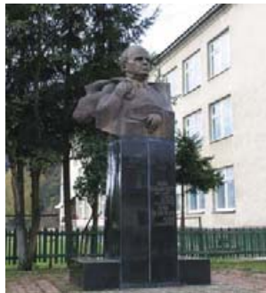
Пам'ятник І. Ольбрахту. Скульптор М. Белень.

На будинку сільської ради, ще з радянських часів, висить меморіальна дошка, на якій написано: «В с. Колочава в 1931 році жив Іван Ольбрахт – один із засновників Комуністичної партії Чехословаччини. Письменник». Іван Ольбрахт (справжнє ім'я – Каміл Земан) народився 6 січня 1882 року у Семітах в Чехії, в родині адвоката Антоніна Земана. Закінчив гімназію, а 1906 року – юридичний факультет Празького університету. 1920 року Ольбрахт нелегально перебував у Москві, де збирав матеріал для майбутніх «Нарисів про сучасну Росію». Революційне повітря Росії надихнуло Ольбрахта на політичну діяльність. Повернувшись на батьківщину, він стає одним із засновників комуністичної партії Чехословаччини і редактором її друкованого органу – газети «Руде право». Одним із