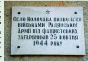
Меморіальна дошка на фасаді сільради.

З цього можна зробити висновок, що село Колочава звільнено Червоною Армією 15, а не 25 жовтня, як вважалося в радянські часи.