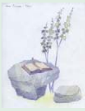
Ескіз скульптурної композиції рукопису Івана Лугоша. Автор В. Шиндра.

Факт встановлення скульптурної композиції повинен стати своєрідною відповіддю чеському письменнику Івану Ольбрахту на його слова, написані в 30-х роках минулого століття, що Колочава – це «... село XI ст., в якому ще не винайшли плуг...», «... Африка у центрі Європи». Можливо, І. Ольбрахт навмисно не хотів на сторінках своїх романів і публікацій бачити освічених і прагматичних колочавців? Очевидно, що фантазія і сенсації були більше до вподоби тодішнім європейським читачам, ніж розповіді про 200-річчя колочавських рукописів. Але, завдячуючи творчості І. Ольбрахта, світ дізнався про Колочава. Нехай і бунтівну та неписьменну!