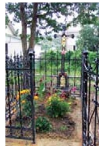
Могила угорського поштаря.

Поруч із чеськими могилами на подвір'ї Святодухівської церкви під деревом є поховання угорця – поштаря і касира, який виплачував гроші тодішнім бокорашам. Рік поховання – 1914, причина смерті – серцевий напад. Огорожу встановили угорські родичі, вона збереглася до наших днів.