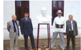
Реконструйований Ленін біля музею «Стара школа».