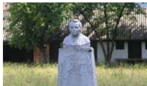
Пам'ятник Олександрі Духнович. Скульптор О. Мондич.

Постамент із погруддям культурно-освітньому діячеві Олександрі Духновичу поставило у Колочаві товариство ім. О. Духновича – організація русофільської орієнтації, культурно-просвітницька робота якої в краї спрямовувалась проти «нижньої української національності» та бойкоту всього, що не мало «руський характер».