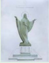
Ескіз пам'ятника Ісусу Христу.