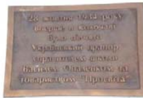
Меморіальна дошка на фасаді музею «Чеська школа».

Активісти товариства «Просвіта» стали провідниками національно-визвольного руху на Закарпатті і керівниками уряду Карпатської України у 1938–1939 роках.