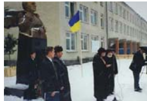
Відкриття пам'ятника І. Ольбрахту.