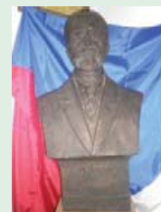
Бюст Президента Чехословацької республіки Масарика.

Погруддя першого Президента Чехословацької республіки Томаша Гарика Масарика потрапило до коложавського музею «Чеська школа» завдяки самим чехам. Директор музею Яна Камєньскова, що у місті Пжерові, доктор Франтішек Гибел разом із численним чеським шкільним приладдям подарував новоствореному 2007 року у Коложаві музею і погруддя Президента. Відтоді «батько» Чехословацької республіки стоїть на почесному місці у класній кімнаті музею. Над ним височіє його вічно актуальний вислів: «Скажи мені, що ти читаєш, і я скажу тобі, хто ти є», поруч державний прапор Чехословаччини.