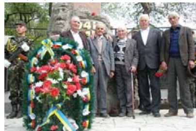
На відкритті відреставрованого обеліску разом воїни радянської, чехословацької і угорської армії.

Всі ці колочавці загинули на одній війні і всі вони зараз вшановані разом. Колочава стала першим прикладом такого Примирення на Закарпатті.