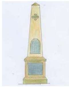
Ескіз обеліска воїнам Першої світової війни. Автор В. Шиндра.

Під час Першої світової війни все Закарпаття, в тому числі і село Колочава, перебувало під владою Австро-Угорщини. Отже, і воювати колочавським воїнам довелося на стороні чужої держави.