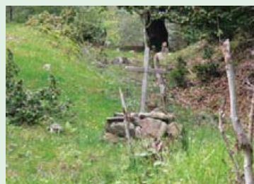
Могила чехословацького десантника до реконструкції.

В Гирсовці словака-десантника, який переховувався, помітила дівчина і повідомила про це священника. Наступного дня угорські жандарми схопили розвідника і розстріляли у зворі поблизу Бринзійового млина (початок Мерешора). Одночасно вони наказали не ховати його в землі, щоб всі бачили, яке покарання чекає на того, хто наважиться на подібні дії проти угорської армії. На місці його загибелі 2003 року встановлено пам'ятний хрест.