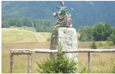
Хрест на Прислопі.

Придорожні хрести здавна були красою колочавських присілків. Ставили їх у пам'ять про важливі події як у житті усієї громади (наприклад, скасування панщини), так і окремих людей (зцілення від хвороби, народження довгоочікуваного первістка та ін).