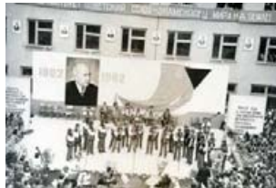
Святкування 100-ї річниці з дня народження І. Ольбрахта на шкільному подвір'ї.