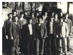
Колочавські «афганці». Фото 1990 р.

В Афганістані приймали участь у бойових діях – 23 колочавці, в Чехословаччині – 8, в Нагорному Карабасі – 3, в Югославії – 2, в Угорщині – 1, Сирії – 3, Іраці – 1, Польщі – 1, на Острові Даманському – 1.