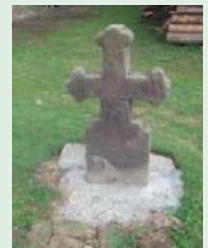
Могила невідомого на території Святодухівської церкви XVII ст.

Біля дерев'яної церкви Святого Духа ще й досі збереглося чимало таких поховань. Одне із них – невідома могила під деревом, яка не містить ніяких підписів. У селі панує думка, що там лежить якийсь відомий колочавський меценат. Дослідження зі встановлення прізвища продовжуються.