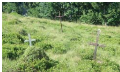
Могили колочавських «революціонерів».

За словами колочавських старожилів, безіменні поховання 1918–1920 рр. «революціонерів» років у Колочаві розташовані поблизу могили Миколи Шугая, де в той час здійснювалися поховання селян.