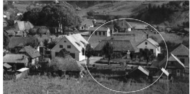
Сквер ім. Леніна (реконструйовано за допомогою комп'ютерної програми Photoshop).