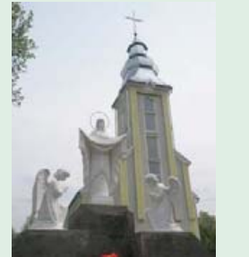
Скульптурна композиція «Покрова Пресвятої Богородиці». Скульптор П.Штаер.

Православна громада цього року теж отримала подарунок від П.Штаера – скульптурну композицію «Ісус Христос».