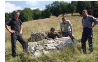
Залишки пам'ятника на Менчулі. Фото 2009 р.

У червні 2010 року планується відкриття нового обеліску, що буде зрештою та встановлений на цьому місці силами колочавської ініціативної групи.