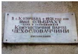
Меморіальна дошка І. Ольбрахту на будинку сільради.

Готуючись до 100-річчя з дня народження чеського комуніста і письменника Івана Ольбрахта, радянське керівництво на Закарпатті розробило широкомасштабний план заходів з цієї нагоди. В рамках святкування було підготовлено до друку книгу Івана Долгоша «Колочава», в якій було викладено творчий шлях Ольбрахта на Закарпатті, особливо під час його перебування в селі Колочава у 1931–1936 роках; було закладено пам'ятний знак в с. Колочава на місці майбутньої скульптурної композиції чеському письменнику; було відкрито шкільний музей ім. І. Ольбрахта. Саме в Коложаві були проведені всі державні урочистості з нагоди 100-ї річниці. Фестиваль україно-чехословацької культури тривав декілька днів. Кульмінацією свята стало закладення гранітної плити з написом «Тут буде встановлено пам'ятний знак Івану Ольбрахту». Святкові заходи закінчилися, а згодом радянська влада забула про обіцянки. Лише через 18 років пригадав про пам'ятник Ольбрахту Геннадій Москаль, тодішній голова Закарпатської обласної держадміністрації. Саме завдячуючи йому у листопаді 2000 року було відкрито пам'ятник. Відкриття пройшло тихо і без особливого пафосу. Автором скульптурної композиції став закарпатський митець Михайло Белень.